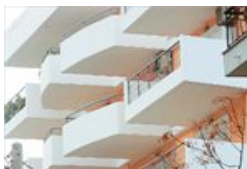
Απροθυμία για τους ημιυπαίθριους χώρους