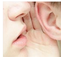
Οι γυναίκες είναι μαρτυριάρες αλλά καλύτεροι σύντροφοι

ΛΟΝΔΙΝΟ Επιστροφή στα θρανία αντί σύνταξης προτείνει για τους 70άρηδες